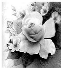
Родные и близкие

В чудесный праздник мы желаем Тепла, понимания, нежности. Всегда чтоб улыбки родных окружали, Друзья согревали сердечностью! Пусть день этот светлый удачу подарит, Исполнит мечты обязательно. Добра и любви только больше пусть станет, Живется всегда замечательно!