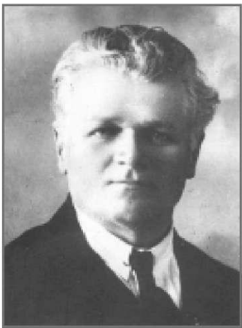
ческой лаборатории Наркомпроса.

С 1790 г. - гетман казачьих екатеринославских и черноморских войск. В начале 1791 г. последний раз посетил Петербург, откуда вернулся к армии, вел переговоры в Яссах. Выехал в Николаев и по дороге скончался.