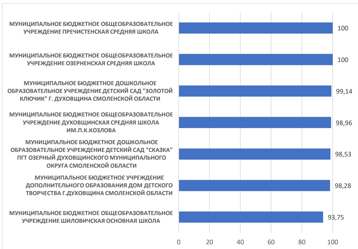
Рисунок 2 – Рейтинг организаций по критерию «Комфортность условий, в которых осуществляется образовательная деятельность»

По второму критерию «Комфортность условий, в которых осуществляется образовательная деятельность» максимальный результат 100 баллов набрали МУНИЦИПАЛЬНОЕ БЮДЖЕТНОЕ ОБЩЕОБРАЗОВАТЕЛЬНОЕ УЧРЕЖДЕНИЕ ПРЕЧИСТЕНСКАЯ СРЕДНЯЯ ШКОЛА и МУНИЦИПАЛЬНОЕ БЮДЖЕТНОЕ ОБЩЕОБРАЗОВАТЕЛЬНОЕ УЧРЕЖДЕНИЕ ОЗЕРНЕНСКАЯ СРЕДНЯЯ ШКОЛА.