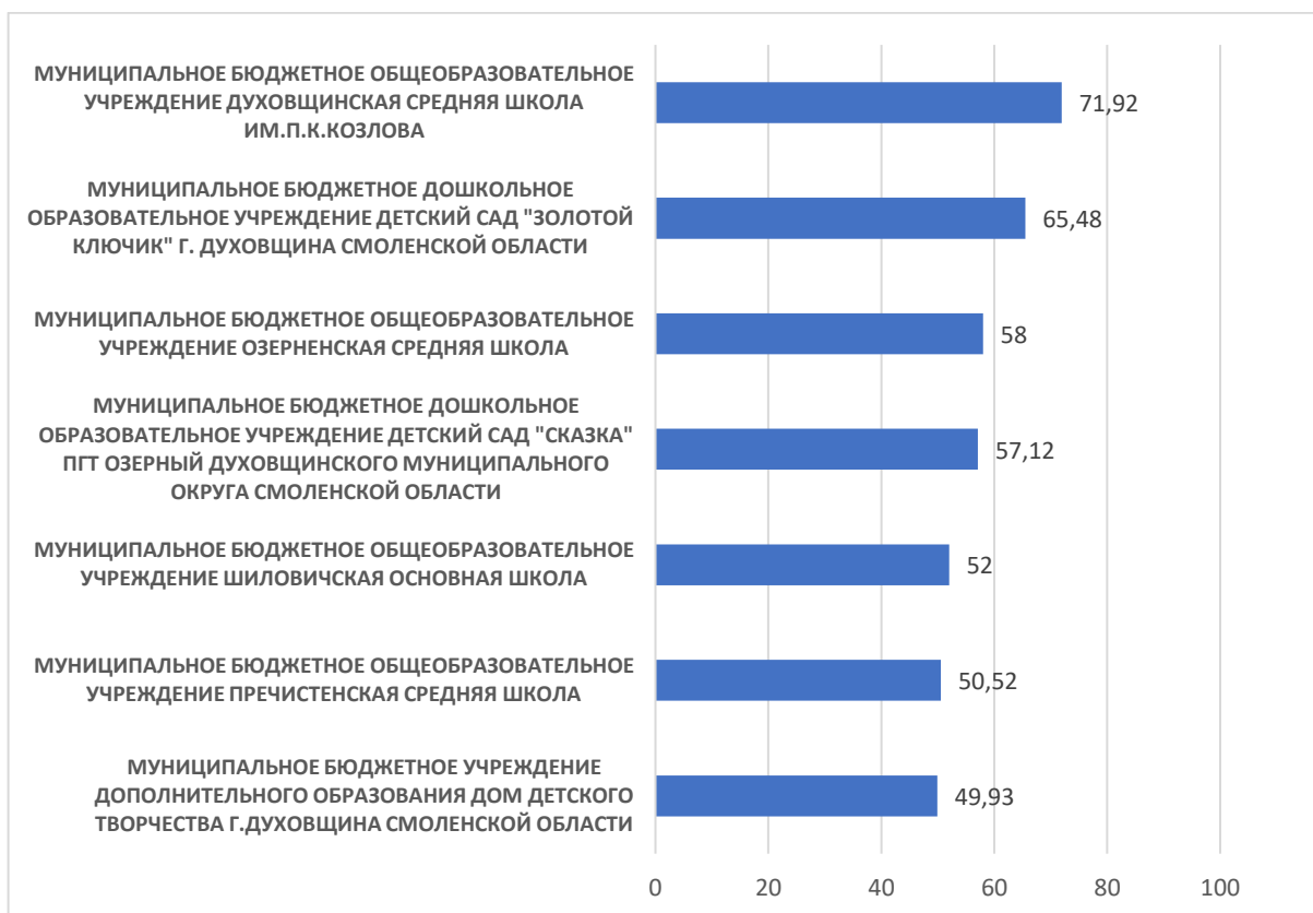
Рисунок 3 – Рейтинг организаций по критерию «Доступность образовательной деятельности для инвалидов»

По третьему критерию «Доступность образовательной деятельности для инвалидов» максимальный результат 71,92 баллов набрало МУНИЦИПАЛЬНОЕ БЮДЖЕТНОЕ ОБЩЕОБРАЗОВАТЕЛЬНОЕ УЧРЕЖДЕНИЕ ДУХОВЩИНСКАЯ СРЕДНЯЯ ШКОЛА ИМ.П.К.КОЗЛОВА.