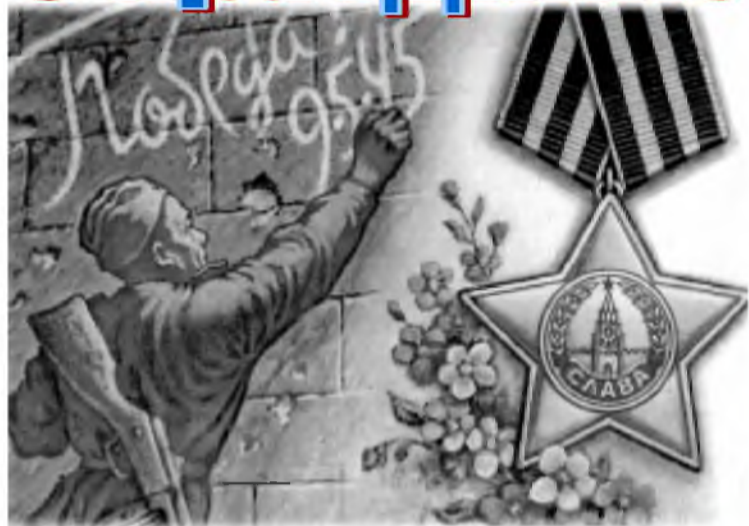
Уважаемые ветераны Великой Отечественной войны!